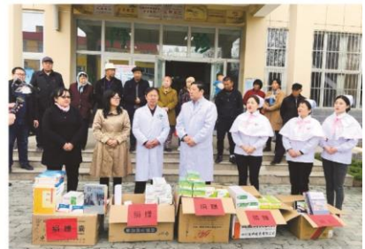
义诊活动结束后，专家团马不停蹄走访村卫生所，了解村医日常工作情况并提出指导建议。