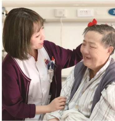
【大年初六】津沽推掌“掌”控节日健康，请锁... 2019年2月10日