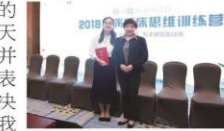
院肝胆科疑难病的诊断实力。(肝胆科)

例诊断完全正确的优异成绩,获得天津赛区优胜奖,并作为唯一选手代表天津参加全国决赛,充分显示出我院肝胆科疑难病的诊断实力。(肝胆科)