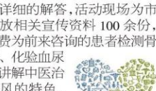
耐心为患者及家属答疑解惑。获得广泛好评。(风湿科)

做了详细的解答,活动现场为市民发放相关宣传资料100余份,并免费为前来咨询的患者检测骨密度、化验尿酸,讲解中医治疗痛风风的特点,耐心为患者及家属答疑解惑。获得广泛好评。(风湿科)