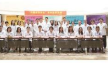
患者跟前,为来院就诊的病人提供细致、更贴近、更温馨的服务。(药学部)

药学党支部学习贯彻党的十九大精神 and 两会精神,以“医疗服务百日行动”为契机,把服务主动地送到患者跟前,为来院就诊的病人提供细致、更贴近、更温馨的服务。(药学部)