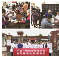
一步普及健康知识,提高村民的健康水平。(帮扶工作组)

今后,医院党委将继续深入贯彻落实帮扶工作,结合农村实际,不断加大健康服务力度,进