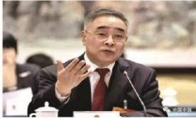
张伯礼 全国人大代表、中国中医科学院院长、天津中医药大学校长

“医疗服务有问题,也一样要找准病因、对症下药。”张伯礼说,为了让医疗服务更好地满足百姓实际需求,中医一附院全院上下积极主动征求患者意见,认真整顿,改进服务流程,提升服务质量。通过近一个月的努力,已兑现了对患者提出的十项服