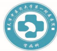
天津中医药大学第一附属医院 肾内科

肾内科于每年世界肾脏日当天举行大型健康咨询及讲座活动,现已成为肾内科的惯例;每年开春之时,肾内科就在科主任杨洪涛的带领下,开始着手布置安排肾脏日的活动,结合当年的主题,选择眼下患者关注的题目进行健康讲座。“是故圣人不治已病治未病,不治已乱治未乱”,虽然我们还未达到圣人,但是作为一附院医护人员,我们始终心系患者,对于已经是肾病患者的给予积极治疗,对于社会公众呼吁大家关注自己肾脏健康,及早预防。习总书记在十九大报告中对于发展祖国中医药事业提出了详细的指导意见,同时也提出“实施健康中国战略”,这是以习近平同志为核心的党中央从长远发展和时代前沿出发,坚持和发展新时代中国特色社会主义的一项重要战略安排,这对于我们来说是机遇,也是挑战,肾内科全体职工会继续“撸起袖子加油干”,为实现科室发展、医院腾飞、助力“健康中国”而贡献自己的力量!