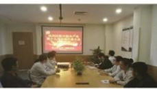
农工支部收看十九大开幕式

10月18日上午九点,中国共产党第十九次全国代表大会在人民大会堂举行,我院各民主党派利用不同形式收听收看十九大开幕式,并通过集中学习讨论、微信群讨论热