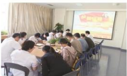
针灸特需第一党支部