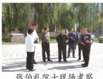
张伯礼院士现场考察

2017年10月6日上午，我院由毛静远院长主持召开了国家临床医学研究中心申报工作推进会。天津中医药大学第一附属医院名誉院长石学敏院士和我院全体院领导出席，科研处、临床研究中心、实验中心、网络中心、院办等相关职能部门、针灸学科和心血管学科骨干等30余人参加了本次会议。