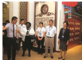
参观国药堂