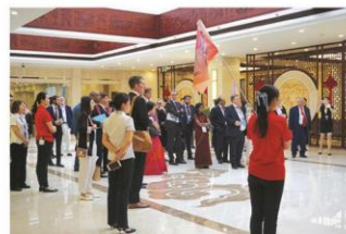
参观国医堂