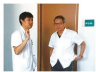
王任贤教授参加了感染疾病科门诊,并逐一进行了指导,对感染预防和控制方面可能会遇到的问题,现场给予了针对性讲解。

感染疾病科病房,对蜂窝织炎、肺炎、肺炎球菌感染、成人 sweet 综合征等病例进行了认真系统的分析,其讲解深入浅出,生动形象,感染疾病科医生及护理人员十分重视与珍惜这样的交流机会,积极与王教授进行了学术互动,气氛热烈,受益匪浅。随后,王任贤教授参观了感染科门诊、发热门诊及肠道