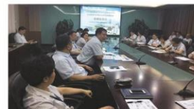
筹备期间共召开十余次协调会