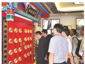
参观国药堂