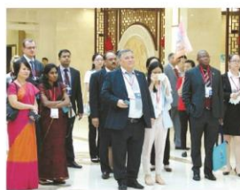
参观国医堂