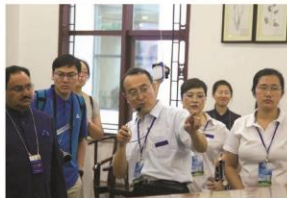
参观国药堂