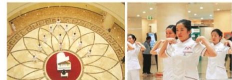
推拿科表演的导引操