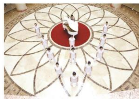
推拿科表演的导引操

伴随着志愿者弹奏的中国、印度、俄罗斯等国家的钢琴曲,嘉宾们在各个展区穿行参观,每到一处都详细的询问、记录、拍照。在医院志愿者组成的专业讲解团队介绍下,神奇的中医技法,精美的中医药展品使国外嘉宾流连忘返,众多国家卫生官员纷纷赞叹传统中医药的独特魅力。通过此次传统医药文化展,既介绍了中医药文化历史的传承,也展示了中医药与现代结合的很多成果。同时也向世界各国展示了我院中医药的强大实力。此次会议对于宣传我院对外形象,推动中医药国际化合作提供了良好契机,对医院的发展具有重要的现实意义和深远的历史影响。