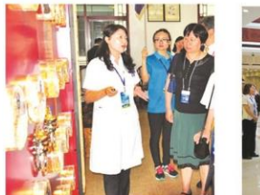
参观国药堂