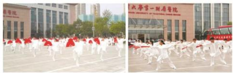
太极扇表演