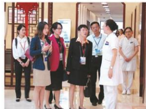
参观国医堂