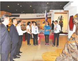
参观院史馆

在四楼,嘉宾们分别参观了国医堂、国药堂和院史馆。中医药文化氛围浓厚的国医堂、国药堂,以其古朴典雅的就医环境和传统的调剂方法令来宾惊叹不已。院史馆丰富的文化底蕴向嘉宾们展示了中医一附院六十年发展的流金岁月。