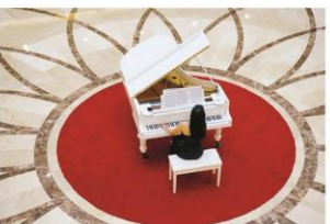
钢琴演奏