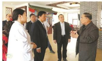
4月13日张伯礼院士来院考察

编者按:2017年7月6日下午,中医一附院圆满完成了金砖国家卫生部长会暨传统医药高级别会议参观医疗机构的接待任务。自此,金砖会接待工作也告一段落。从2月份接到上级组织的接待任务开始,在院领导的带领下,全院自上而下总动员,先后有300余人参与筹备、接待、现场展示工作,他们为完成好上级交付的展示中医医疗机构这一重要政治任务,精益求精、不舍昼夜,为接待工作作出了巨大付出。本次参观筹备工作增加了全院职工凝聚力,充分展示了天津中医一附院人团结奋进的精神。为此,我们记录了他们在准备和接待工作中的点点滴滴,以表达敬意。