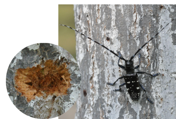
光肩星天牛及卵槽

据近期调查，我市几种刺蛾均在幼虫危害期，危害较多的有双齿绿刺蛾、黄刺蛾，此外中国绿刺蛾、扁刺蛾、白眉刺蛾、褐边绿刺蛾也有发生，应注意检查防治，药剂应选用 1.2% 烟参碱乳油 1000 倍液喷洒杀灭。