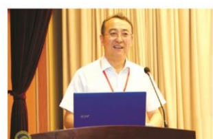
天津中医药大学第一附属医院院长毛静远致辞