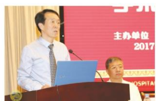
天津中医药大学党委书记李庆和宣读重要决定