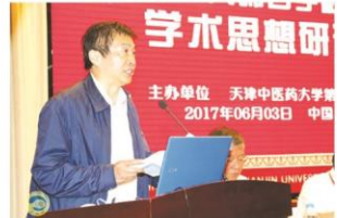
国家中医药管理局副局长于文明讲话