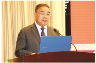
中国中医科学院院长、天津中医药大学校长张伯礼院士讲话