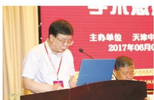
中国中医科学院针灸研究所所长朱兵致辞