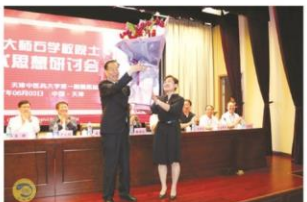
学生代表向石学敏院士献花