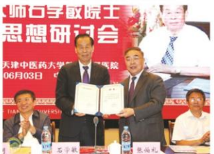
天津中医药大学学术委员会授予石学敏院士终身教授称号

国医大师石学敏院士学术思想研讨会,为今后更好地学习、继承和发扬石学敏院士的学术思想具有重要意义。来自海内外的中医药专家学者,国内石学敏院士的学生、弟子、医院代表400余人聚集一堂,对继承国医大师石学敏院士的学术思想进行了广泛而深入的探讨。