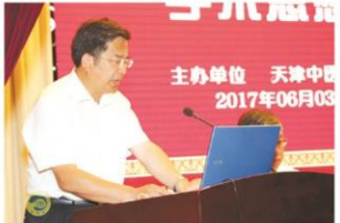
天津市卫生计生委副主任申长虹讲话