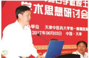
天津市教委主任王璟讲话