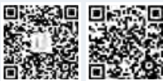
“天津司法”官方微信二维码 “天津司法”官方微博二维码