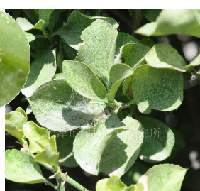
黄杨叶螨及被害状