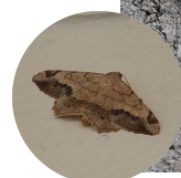
国槐尺蛾老熟幼虫及成虫

据近日调查，美国白蛾一代幼虫多为 2-3 龄，最大网幕已达 50 公分左右。尚有部分初生网幕，未见破网危害的幼虫。当前仍可喷洒 20%除虫脲 6000-8000 倍液杀灭幼虫。同时应抓紧剪除网幕杀灭网内幼虫。剪过网幕的树应喷洒一次 1.2%烟参碱乳油或 1%苦参碱液剂 1000 倍液，灭杀遗留在树上的幼虫。我市个别小区路段发生严重，各区应抓紧检查防治。