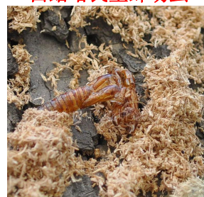
小线脚木蠹蛾蛹皮

据近日调查，部分地段碧桃、紫叶李、紫叶桃、西府海棠等多种树木受该螨严重危害。焦叶、糊叶明显可见，即将造成落叶现象，应加紧防治。防治用药应选用 1.8%阿维菌素 6000 倍液或 500 倍液晶体石硫合剂进行喷雾。