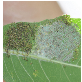
美国白蛾初孵幼虫

据本周初调查，一代美国白蛾正处于幼虫孵化盛期，初孵幼虫开始结网危害，此期尚可见到成虫和卵块以及正在产卵的成虫，当前应尽快完成全面喷洒除虫脲杀灭初孵幼虫的防治工作，同时还应进行人工剪除初生网幕、卵块和杀灭成虫的防治。