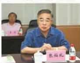
团队学术指导张伯礼院士

“中医药防治心血管疾病研究”教育部创新团队自 2013 年批准建设以来,在张伯礼院士的指导和毛静远教授的带领下,紧密围绕中医药防治心血管疾病的国家行业需求,以重大科研项目为载体,研制了心血管疾病中成药二次开发核心技术体系并产业化;建立了冠心病古今文献信息数据库;揭示了冠心病“阳微阴弦”病机特征的现代内涵;牵头制定《慢性心力衰竭中医诊疗专家共识》;彰显加载中医药治疗方案进一步提高冠心病心力衰竭的临床疗效;