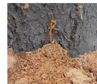
桃红颈天牛被害状