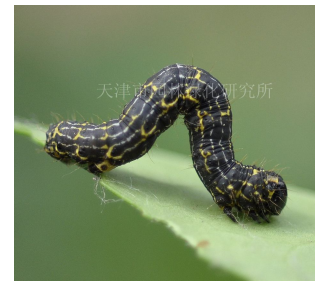
丝绵木金星尺蛾幼虫

据本周初调查，查到丝绵木金星尺蛾幼虫危害黄杨，目前虫体大小为 3 厘米左右，虫龄已达 4 龄。该虫在我市一年发生 3 代，以蛹在土中越冬，三代幼虫危害期分别在 5 月下旬-6 月中旬（一代）、7 月中旬-8 月上旬（二代）、8 月中旬-10 月（三代）。食害植物有黄杨、丝绵木、卫矛（胶东卫矛、华北卫矛）、女贞、扶芳藤、榆、榔榆、杨、柳、槐等，此虫易造成叶片被吃光现象，幼虫有吐丝、假死习性。发现危害应及时喷洒 1.2% 苦烟乳油 1000 倍液。