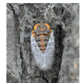
草履蚧第二次脱皮